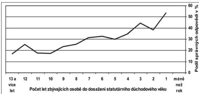
Graf č. 1: Schopnost osob v předdůchodovém věku správně stanovit okamžik, kdy dosáhnou nároku na starobní důchod